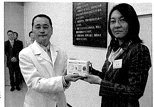
緊急告知FMラジオの貸与式が、5月24日に市長対話室で行われました。